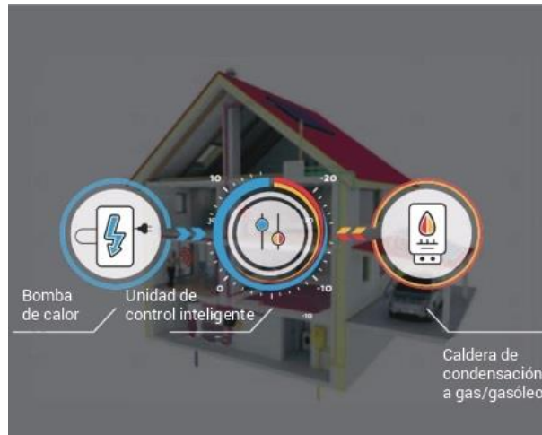
Imagen 2: una bomba de calor híbrida combina varias fuentes de energía utilizando una unidad de control inteligente