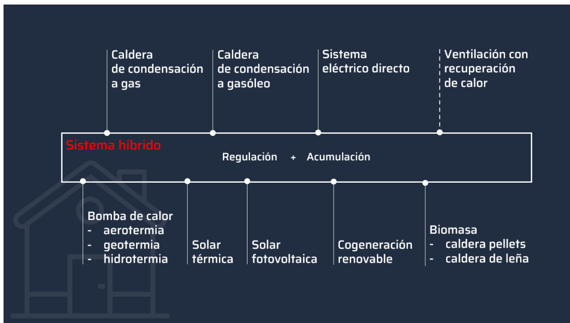
Imagen 1: Sistema híbrido de calefacción

Estos sistemas que cuentan con al menos dos generadores de calor se llaman también sistemas bivalentes y aprovechan las ventajas de cada fuente: la fiabilidad, seguridad y rapidez de una caldera frente a la reducción de costes y emisiones de las energías renovables. Para ahorrar costes de calefacción a largo plazo y contribuir al máximo a la protección del medioambiente, tiene especial sentido la integración en el sistema de, al menos, una fuente de calor procedente de energías renovables.